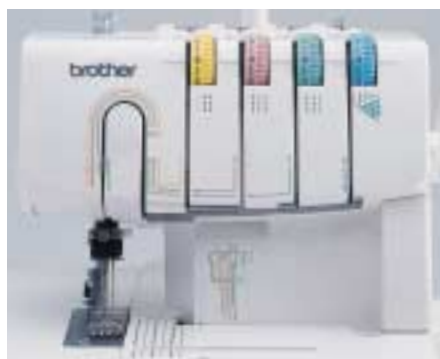
Système d'enfilage simplifié Guide-fil avec code couleur