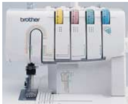
Système d'enfilage simplifié Guide-fil avec code couleur