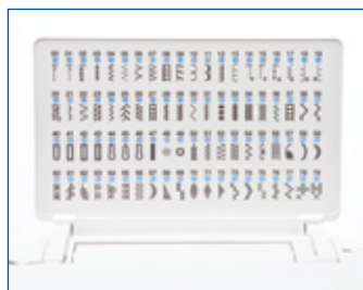
Tableau de référence

Il vous suffit de positionner une canette pleine et vous êtes prêts à coudre.